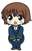
上毛電鉄友の会 マスコットキャラクター 赤城いずみ

2024年9月1日(日) 鉄道遺構を見学するハイキングを実施します。(2024年8月31日より変更) ※詳しくは友の会フェイスブックでご確認下さい。