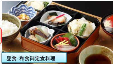
昼食・和食御定食料理