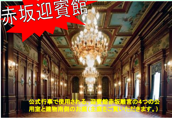
公式行事で使用される、迎賓館赤坂離宮の4つの公用室と建物南側のお庭(主庭をご覧ください。)