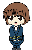
上毛電鉄友の会 マスコットキャラクター 赤城いずみ

また上毛電鉄沿線より遠方のお客様や公共交通にて参加が困難なお客様には、「上電パーク&ライド」無料駐車場が駅前にございますので、用途にあわせてご利用ください。